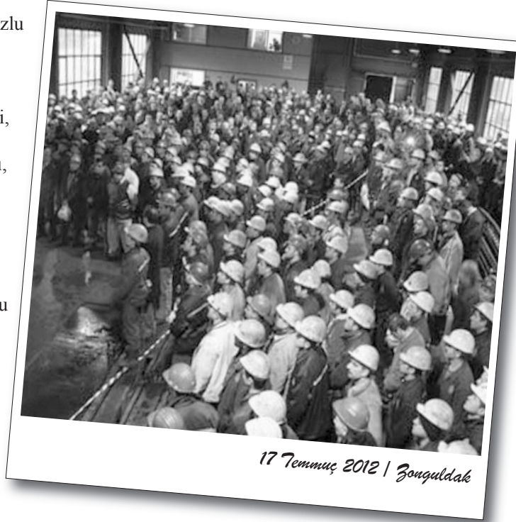
17 Temmuz 2012 | Zonguldak

GMİS Başkanı Eyüp Alabaş ise, işçilere tüm konularda mağduriyetlerinin giderileceği sözünü verdi. İşçilerin tepkisini yatıştıran Alabaş, "Eyleminiz amacına ulaşmıştır. Şimdi ocağa girin, işinize ve ocağınıza sahip çıktığınızı gösterin." diyerek eylemi sona erdirdi. Bunun üzerine işçiler 1,5 saat süren eylemlerini bitirip ocağa girdi.