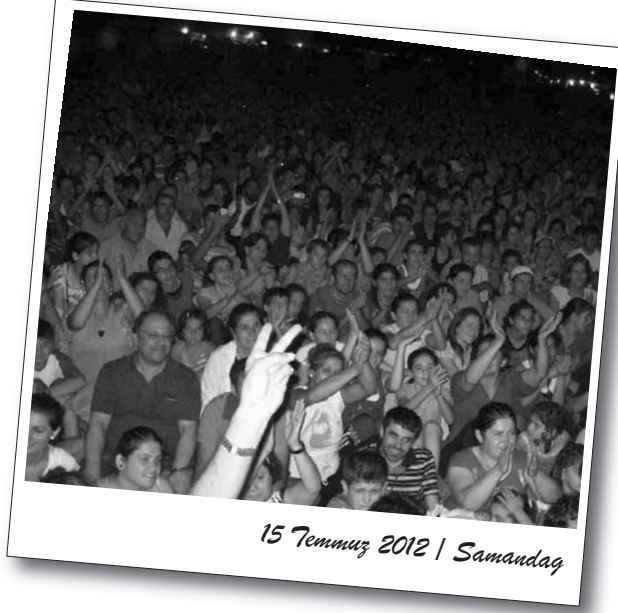
15 Temmuz 2012 | Samandağ