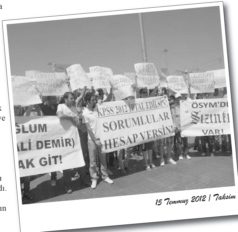
15 Temmuz 2012 | Taksim