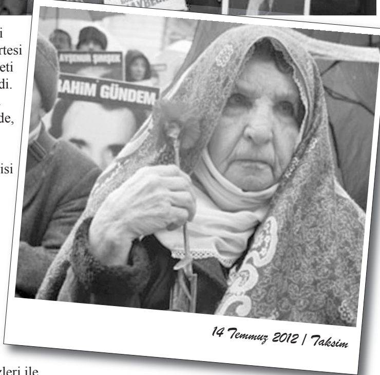
14 Temmuz 2012 | Takvim