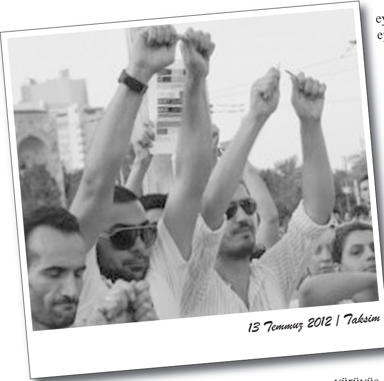
13 Temmuz 2012 | Taksim

2012 KPSS sonrası açığa çıkan skandal, mağdurlar tarafından eylemlerle protesto ediliyor. Kendilerini "KPSS İptal Edilsin Grubu" olarak adlandıran KPSS mağdurları, 15 Temmuz günü İstanbul'da yaptıkları basın açıklamasıyla sınavın iptal edilmesini ve mağduriyetin önüne geçilmesini istedi.